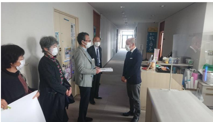
2月7日 市長出張中のため市職員へ手渡しました